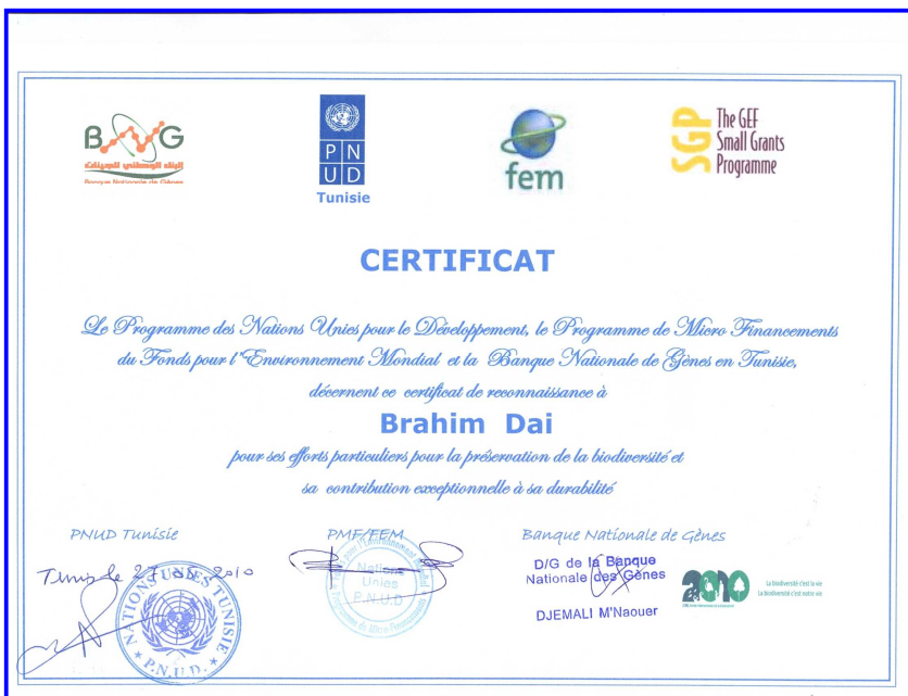
Exemple d'une attestation délivrée à un agriculteur