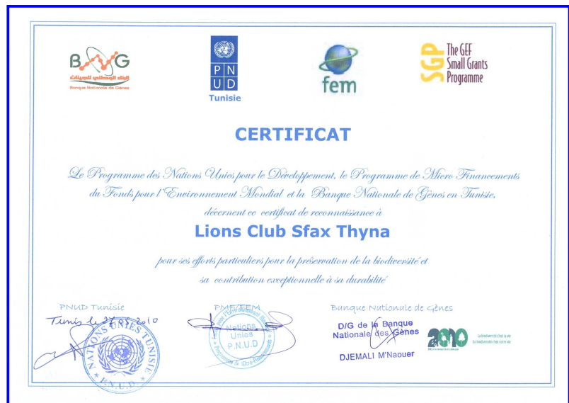
Exemple d'une attestation délivrée à une ONG

4. Des certificats de reconnaissance ont été décernés à sept agriculteurs et huit ONGs pour les efforts particuliers qu'ils ont déployés pour la préservation de la biodiversité et leurs contributions exceptionnelles à sa durabilité