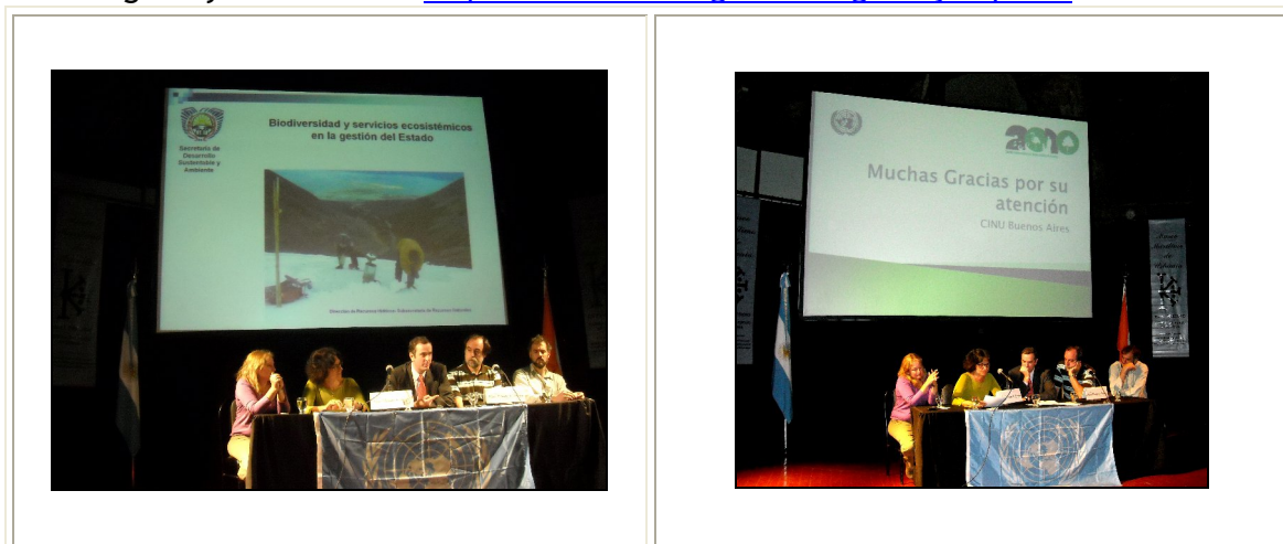
Photo gallery available at: http://www.onu.org.ar/viewgallery.aspx?49