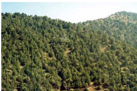
Среднегорная хвойно-лесная экосистема

Наиболее ценными сообществами являются разнокустарниково-остепенные и разнотравно-олуговелые можжевеловые леса.