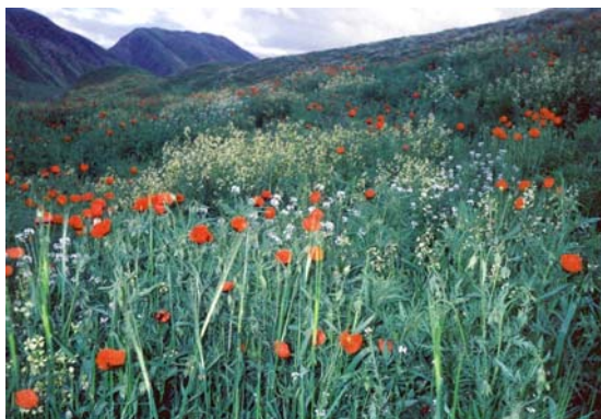
Низкогорная саванноидная экосистема

Carex pachystylis ), ферула ( Ferula kokanica , F. kuhistanica ), зопник ( Phlomis bucharica ) и другие виды растений.