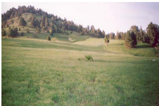
Среднегорная хвойно-лесная экосистема

В составе лесных растительных сообществ встречается значительное количество диких сородичей плодовых – яблоня ( Malus ),