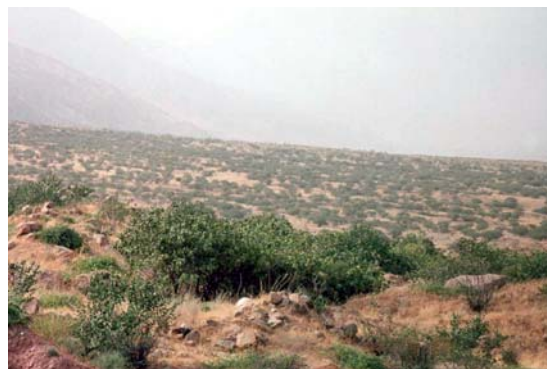
Среднегорная ксерофитно-редколесная экосистема

груша ( Pyrus ), алыча ( Prunus ), боярышник ( Crataegus ), барбарис ( Berberis ).