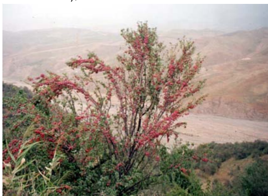
Дикорастущая слива ( Prunus )