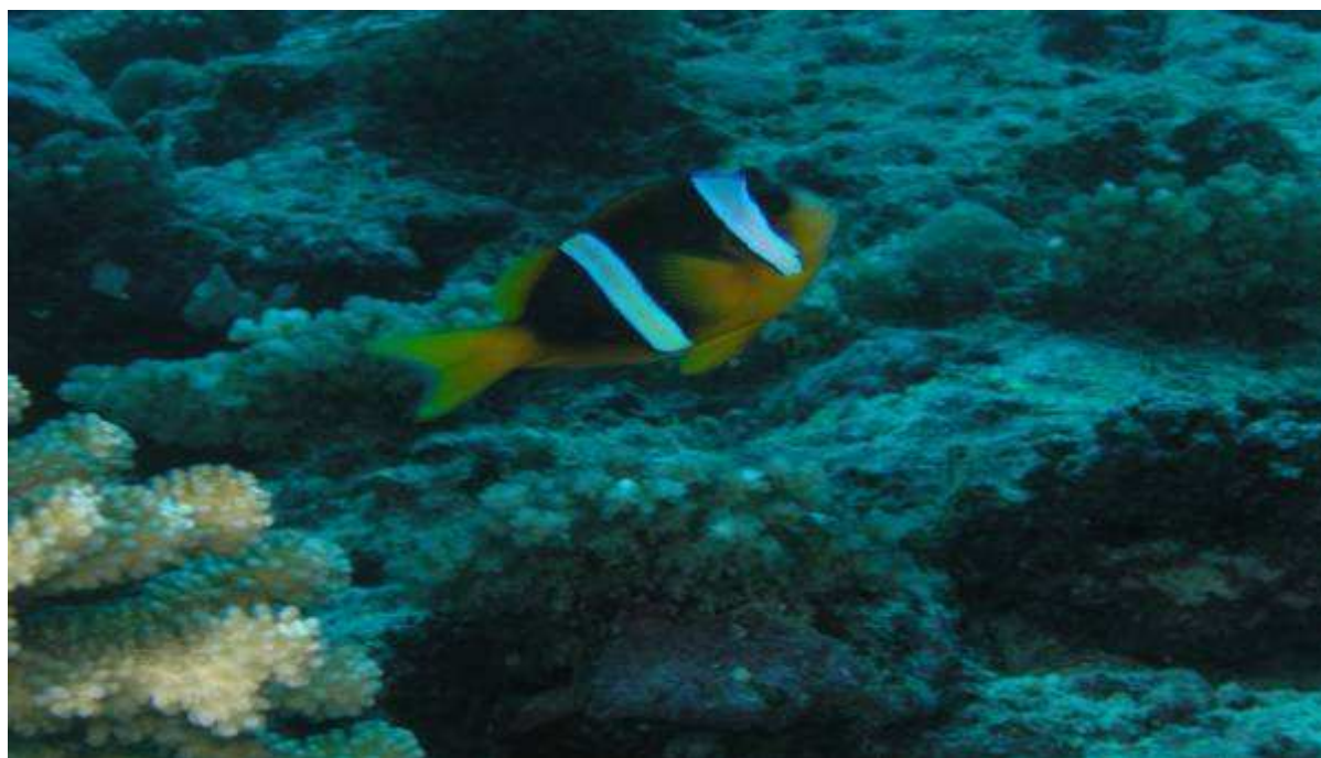
Fonds marin à Itsandra

Au niveau terrestre, les mauvaises pratiques agricoles et forestières, le système de culture sur brûlis, l'exploitation du bois de chauffe (64%) et du bois d'œuvre (30% ) (Andiliyat, 2007) ont conduit à des prélèvements importants sans réimplantation, annihilant ainsi la possibilité de régénération naturelle de la forêt et des espèces végétales endémiques. « Aujourd'hui les formations primaires n'existent que sous forme de lambeaux résiduels qui reculent sans arrêt devant la hache du bûcheron et le feu du défricheur » (P. Vérin, Les