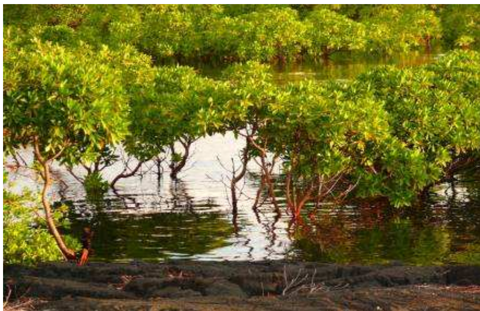
Mangrove de Domoi Mboini (Grande Comore)

Le peuplement faunistique de cet écosystème est essentiellement constitué de nombreux poissons, des crustacées mais aussi d'oiseaux d'eau (hérons, échassiers, Martin-pêcheur, ...).