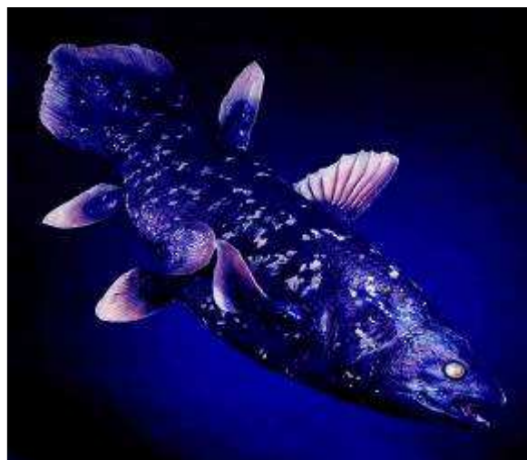
Coelacanthé : Latimeria chalumnae

La flore de l'archipel des Comores est estimée à environ plus de 2000 espèces (Adjanohoun et al. 1982). Elle a une grande similitude avec celle de Madagascar. Elle ne connaît qu'une faible influence du continent africain. Il faut noter qu'une série de formes sont endémiques sans trop s'écarter des espèces des îles voisines. Cependant, des liens avec la flore de l'Inde et de l'archipel de Malaisie sont observés. La flore montagnarde montre de grandes ressemblances avec celle des hauts plateaux de l'Afrique de l'Est et centrale (Voeltzkow, 1917).