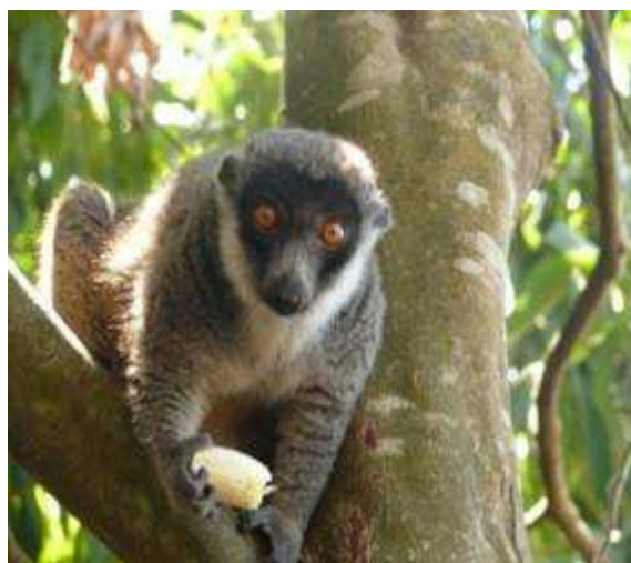
Maki : Lemur Mongoz