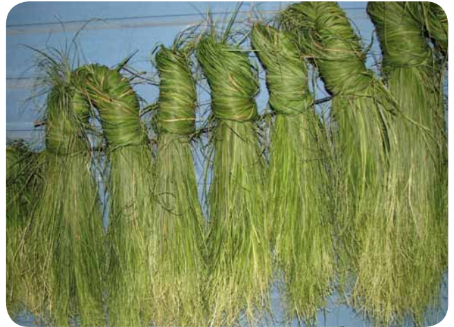
● Hammastunturin erämaa-alueelta kerätään saamen käsityön raaka-aineita. Kuvassa kuivumassa kenkäheiniä, joita käytetään nutukkais-sa, poronahasta tehdyissä karvakengissä, eristeenä ja lämmikkeenä.