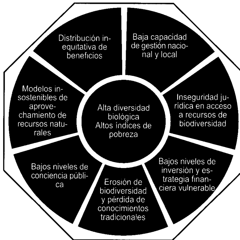
Fig. 2. Insostenibilidad del Modelo Actual de Conservación de la Biodiversidad