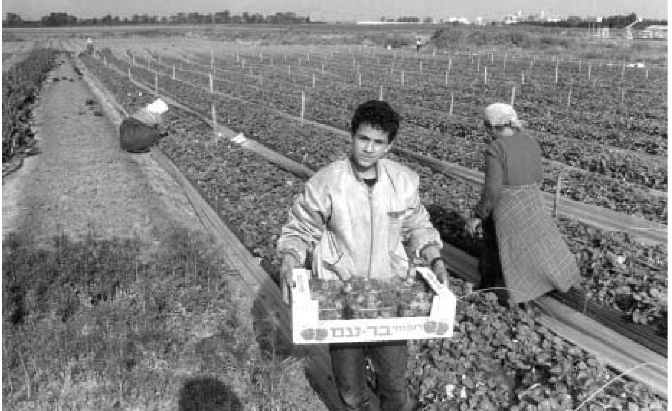
Наиболее строгие правила и процедуры биобезопасности касаются ГМО, которые предназначены для интродукции в окружающую среду.

регулировать свой импорт на основе внутреннего законодательства.