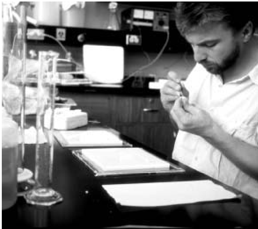
С ПОМОЩЬЮ СОВРЕМЕННЫХ МЕТОДОВ УЧЕНЫЕ МОГУТ ПРОИЗВОДИТЬ ТОЧНЫЕ МАНИПУЛЯЦИИ СО СЛОЖНЕЙШЕЙ ГЕНЕТИЧЕСКОЙ СТРУКТУРОЙ ОТДЕЛЬНЫХ ЖИВЫХ КЛЕТОК.

В 1995 году Стороны Конвенции о биологическом разнообразии откликнулись на эту проблему, приступив к переговорам по разработке юридически обязательного соглашения, которое должно было решить вопросы потенциальной опасности, сопряженной с ГМО. В январе 2000 года эти переговоры завершились принятием Картахенского протокола по биобезопасности. В этом Протоколе, названном в честь колумбийского города, где проходил завершающий раунд переговоров, впервые изложена всесторонняя регулятивная система, обеспечивающая безопасную передачу, обработку и использование ГМО, подлежащих трансграничному перемещению. Таким образом в Протоколе делается попытка удовлетворить нужды потребителей, промышленного сектора и окружающей среды на многие десятилетия вперед. В настоящей брошюре разъясняются принципы работы этой системы.