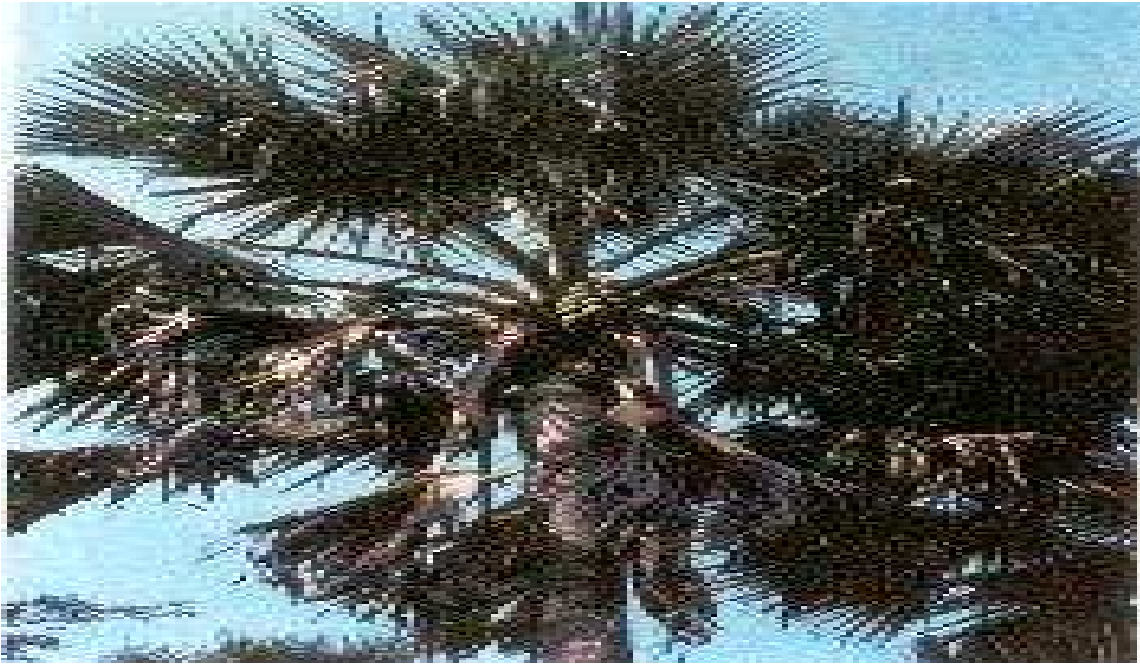
le palmier doum : borassus aetiopum