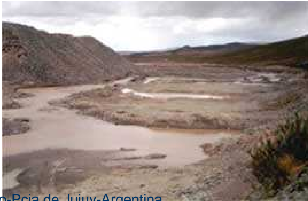
Orosmayo-Pcia de Jujuy-Argentina