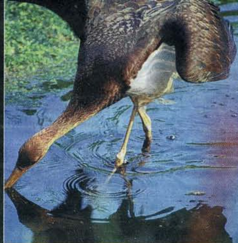
De zwarte ooievaar.