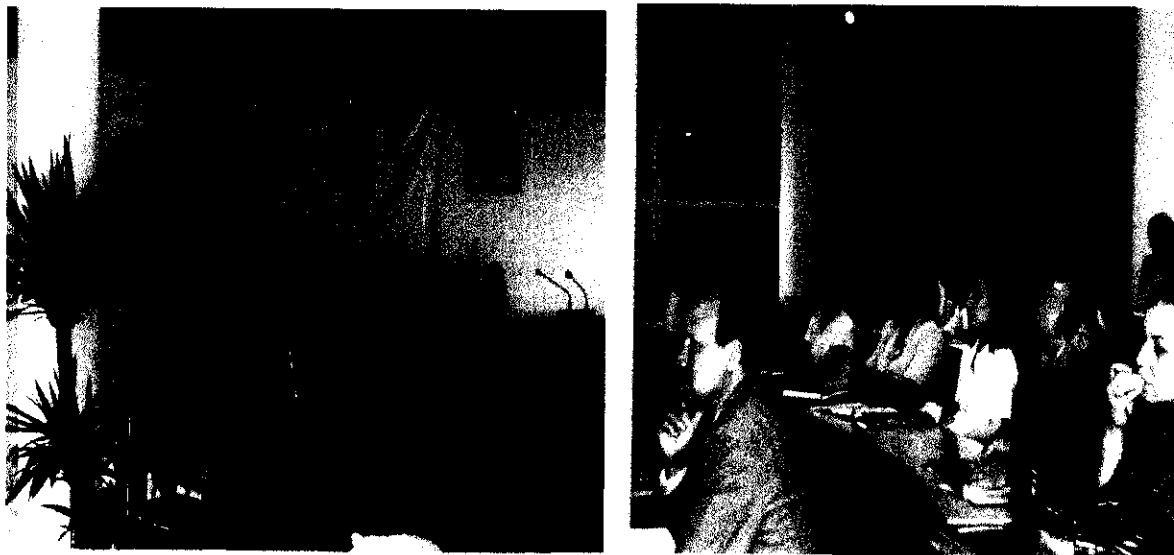
Fig. 7 et 8 : journée d'étude « Biosécurité et Désertification », MATE, 21 Mai 2006