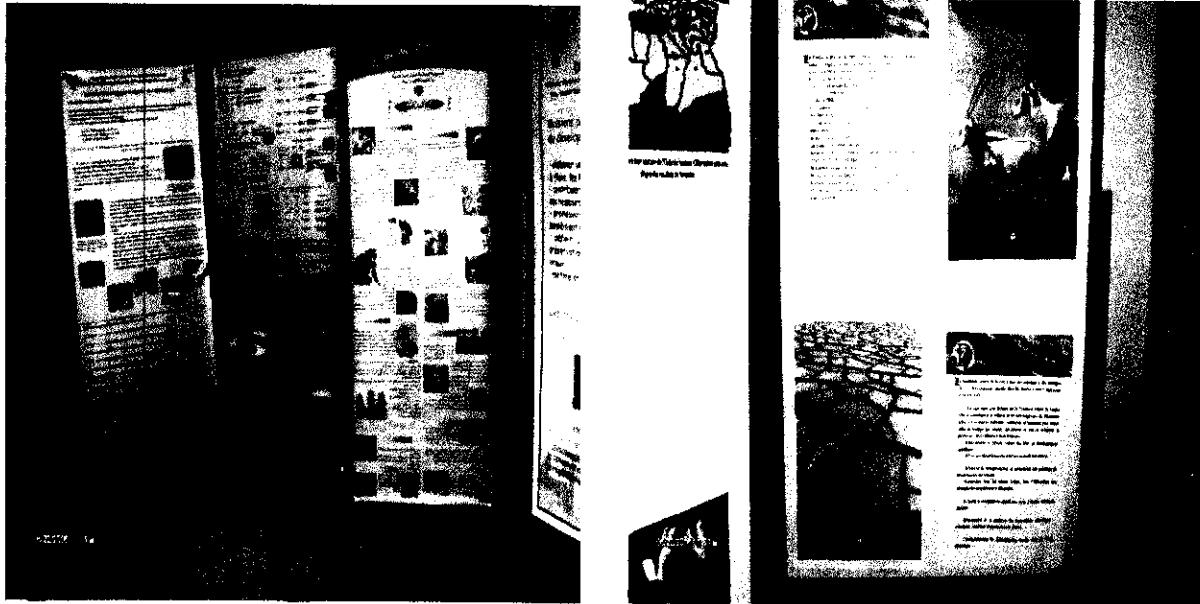
Fig. 1 et 2 : exposition à Dar Dounia (Bab El Oued, Alger)

Parallèlement, des portes ouvertes ont été organisées du Samedi 20 au Mardi 23 Mai 2006 à DAR DOUNIA (Bab El Oued, Alger) où le Ministère de l'Aménagement du Territoire (Sous Direction chargée de la Biodiversité), le Centre National de Développement des Ressources Biologiques (C.N.D.R.B.) ainsi que la Fondation Déserts du Monde ont exposé.