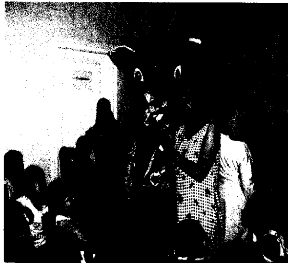
Fig. 3 et 4 : cours sur la Biodiversité présenté au Centre National des Formations à L'Environnement (C.N.F.E.)