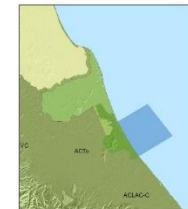
Diagrama de Ubicación